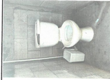
Foto 5: Sustrucción de 4 inodoros los cuales se encuentran quebrados y con otros desperfectos como caída de agua, rajaduras, otros.