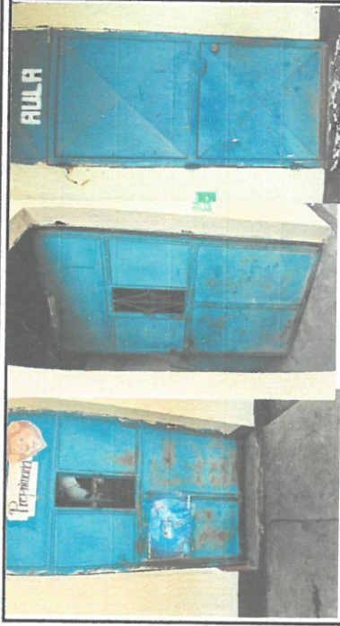
Foto 1: Reparación, mantenimiento y pintada de 7 puertas de cocina, salón y dirección.