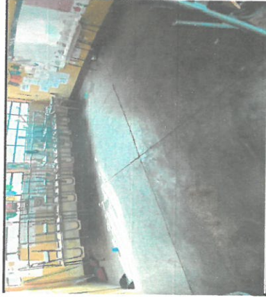
Foto 3: Sustrucción de piso de cemento por piso de granito para 3 aulas